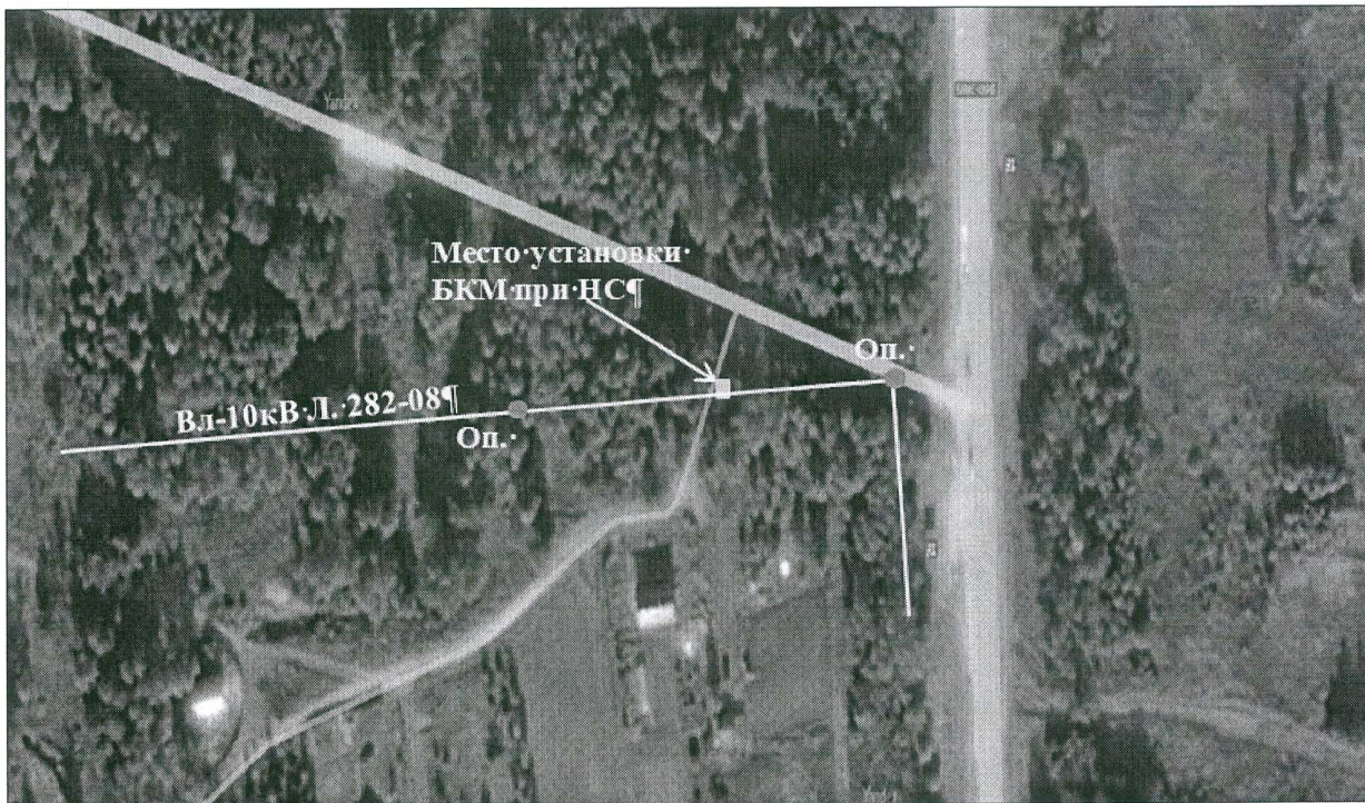
Пролёт опор № 105-106 ВЛ-10 кВ филиала ПАО «МРСК Северо-Запада» «Псковэнерго»